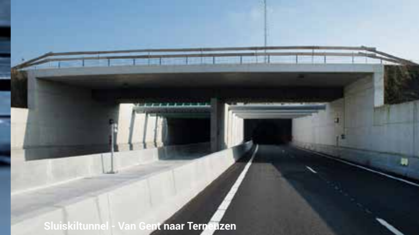
Sluiskiltunnel - Van Gent naar Ternäuzen